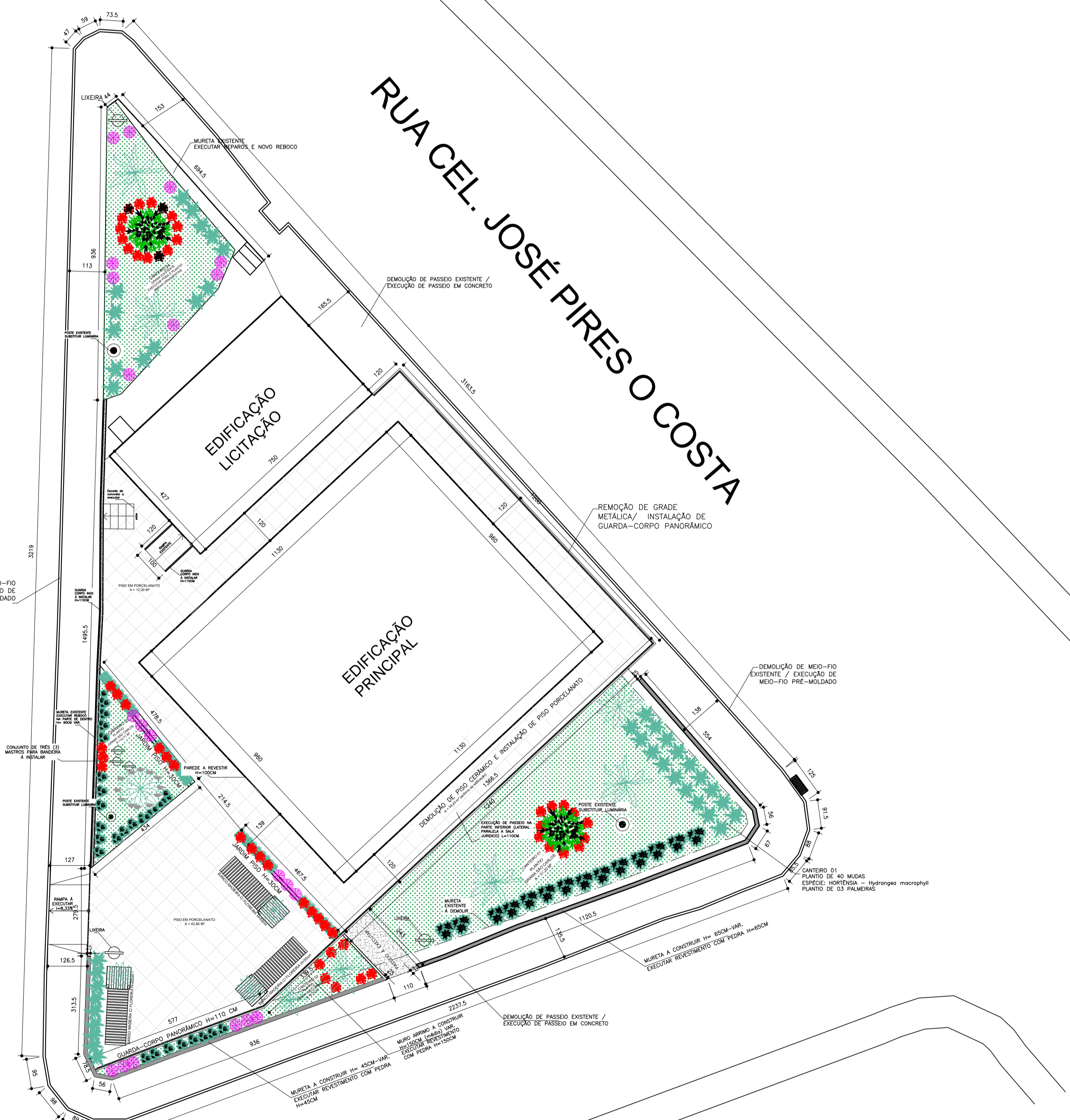
PLANTA BAIXA - SEDE PREFEITURA ESCALA: 1/75